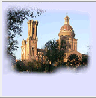
Esglesia de St Andreu