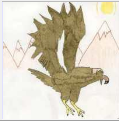
Àguila Daurada (4t)

El Gegant Joanot era com tothom, només que una mica més alt i una mica més gros. Mesurava aproximadament tres metres i mig d'alçària.