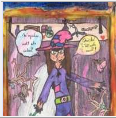
Bruixa Berrugona (6è)