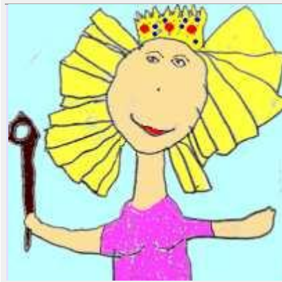
Fada Poruga (1r)

A Gegantolàndia tenia altres amics com la Fada Poruga , el Gegant Petit i l' Unicorn de Colors .