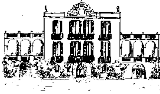
Can Carasses després de 1856

A Gegantolàndia tenia altres amics com la Fada Poruga , el Gegant Petit i l' Unicorn de Colors .