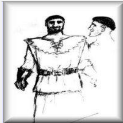
Dibuix del Gegant

El Bartomeu anar cap al sud i quan va trobar l'església de Sant Andreu, va marcar unes pedres amb el signe &* i allí i posar una bossa de pedres precioses del Gegant.