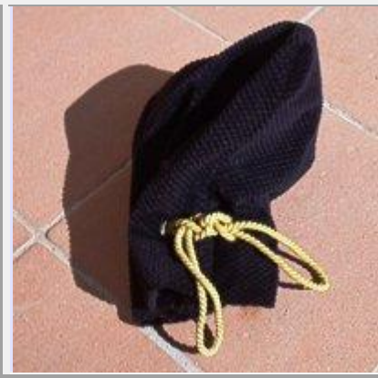
Bossa amb pedres

El Guillem cavalcà cap al Tibidabo fins arribar a una font d'on raja aigua amb gust de ferro, en aquest lloc i va amagar una arca, amb un manuscrit al seu interior .