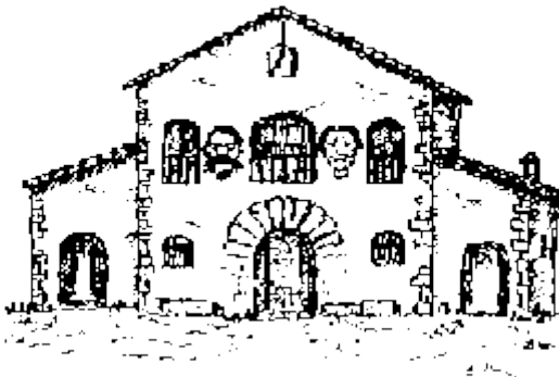
Antiga masia de Can Carasses el 1630

En Joanot havia arribat a aquesta masia buscant tranquil·litat i el bon temps. I es dedicava a treballar les terres i le vinyes que hi havia al voltant.