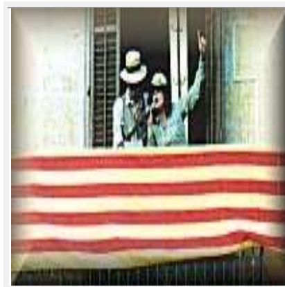
Quan vatornar el Gegant

Si el voleu veure només heu de venir a la nostra escola o també el trobareu passejant pel barri de Sant Andreu el dia de la Festa Major.