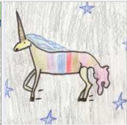
Unicorn de Colors (3r)

Però també tenia algun enemic com ara l' Escorpí Rosa , la Bruixa Berrugona i l' Àguila Daurada .