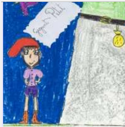
Gegant Petit (2n)